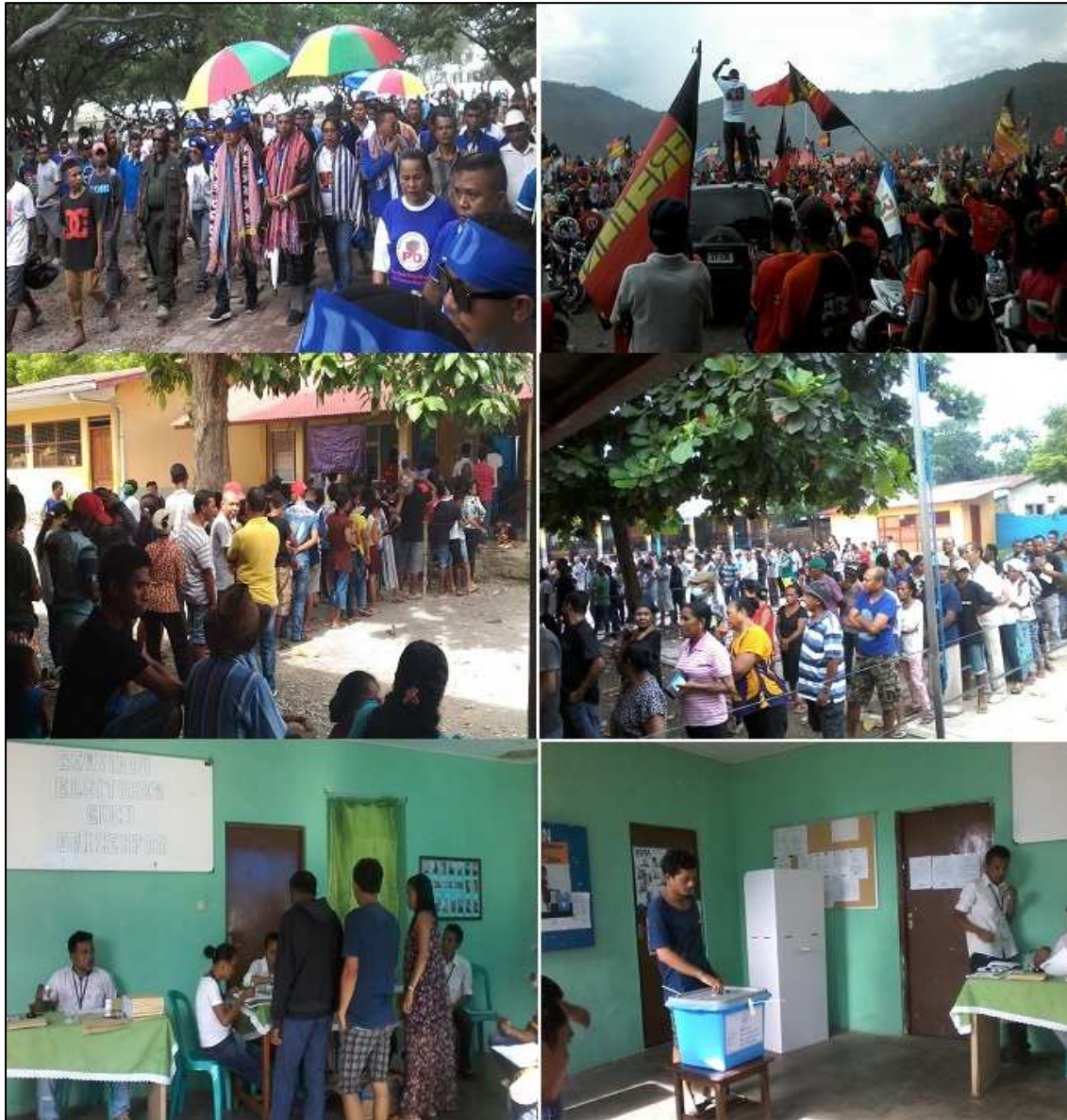
Dokumentasaun NGO Belun, Kampaña no Eleisaun Prezidensiál, 20 Marsu 2017.